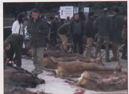
Gran expectación, en la junta de carne.

los mejores resultados, que las 26 rehalas que se iban a soltar, tratarían de poner en valor la materia prima que el monte acogía, y cuyo trabajo debería, y así lo fue, ser hecho a conciencia, algo que, de manera singular, realiza Márquez al or-